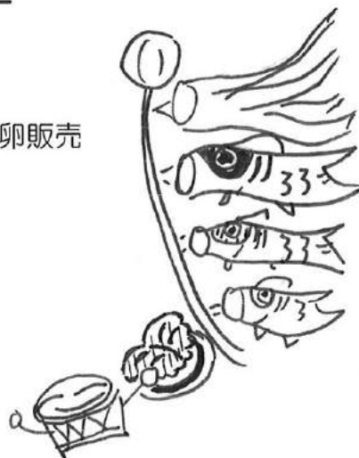
仲間も販売を担当しました