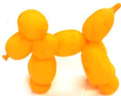
バルーン人形、風船で作った犬

購入は初めてではないお客様に笑い太鼓の主力商品である「めぐみ卵」の味を尋ねてみました。すると「身がギュッと詰まっている」「濃くておいしい」という大変喜ばしい感想を戴きました。職員の方のお休みが多かったようで、たくさんのお客様とお会いすることが出来なくて残念でした。