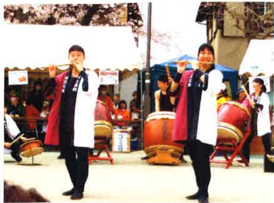
演奏に来るのを毎年楽しみにしています

4月の第1土曜日である4月2日に毎年恒例となっています「桜まつり」を実施しました。前日のテント張りの準備中に雨が降ってきて、翌日の天気心配でしたが、当日は天気が良くてよかったです。