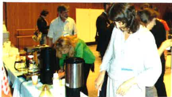
穂の国とよはし芸術劇場 PLATにて