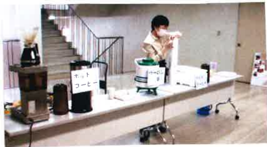
豊橋創造大学にて