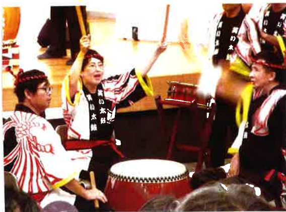
どーんっどこどんっ！そーれっ！

「大勢のお客様にお越しいただき感謝しました。『間違えたらどうしよう。』と不安な気持ちにもなりました。叩き終わると拍手の雨が降ってきました。これからも精一杯練習に励もうと思います。」