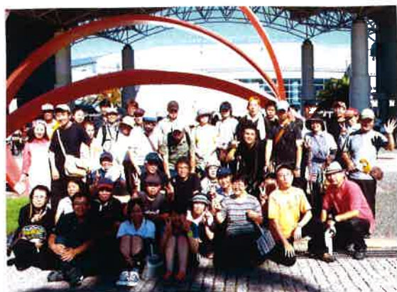
笑い太鼓・集合写真

「売れてるようで、売れて無いようで。笑い太鼓のブースは他と離れていて、お客さんにこちらに来てほしいなと思った。賑わっている方へ売り歩いたら良かったかもしれない。足腰の調子悪くて行けなかった。」