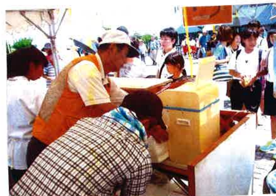
かき氷担当さんは大忙し

「かき氷は完売しました。去年より大勢の人がいきいきフェスタにきていました。残ったら一杯もらえるかなと思ったけど気づいたら全て売れていました。」