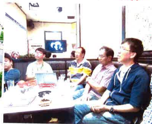
いつも二部屋に分かれていたけど、みんなで一部屋も新鮮でいいね。