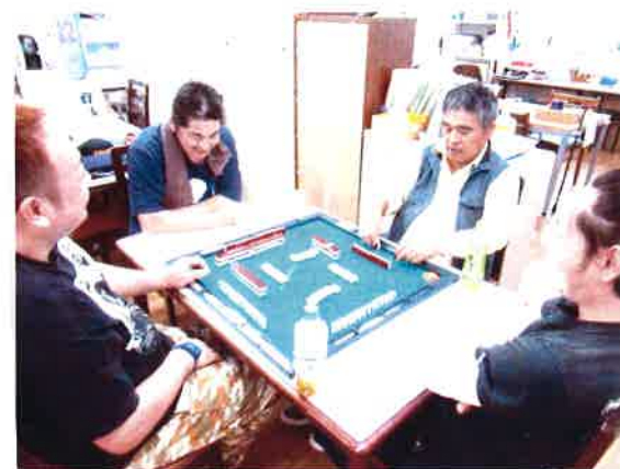
大好きな時間を過ごせて満足です。

準備段階で竹が使用できないことが分かり残念に思いましたが、食卓用の流しそうめん器を当日スタッフが用意してくれて気分を味わえました。麺をたくさん入れ過ぎて流れなくなりました。