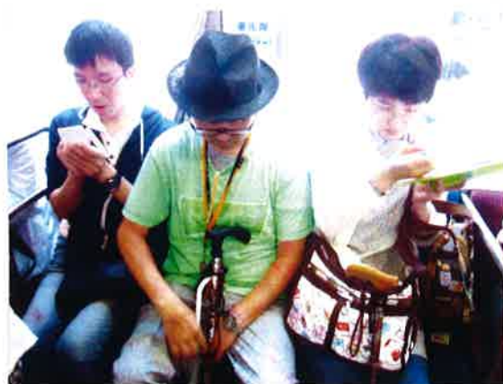
市内電車の中、もうすぐ着くかな。